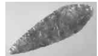
Pilspets från bronsåldern.

H ållristningen vid Torp-Kålsby gjordes nog inte på en dag, utan arbetet fördelades på dagar, veckor, månader, år, ja kanske århundraden. Det var ett mödosamt och omfattande arbete, kanske upplättat genom sång, kanske utfört under speciella riter. Det var ett viktigt åtagande som spelade stor roll för de omkringboende. En gång gav dessa hållar ett klart och tydligt meddelande till bygdens folk, men idag är det ingen som vet vad de egentligen betyder.